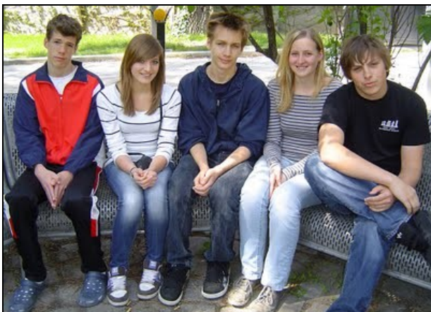
Das Salzburger Quintett bei den STM in Wien

Keinesfalls nach Wunsch verliefen die U16 und U18 Staatsmeisterschaften für unsere Teilnehmer. Wer genauere Berichte und Informationen erhalten will, der ist auf der Page des ATSV Ranshofen bestens aufgehoben! http://ranshofen.blogspot.com