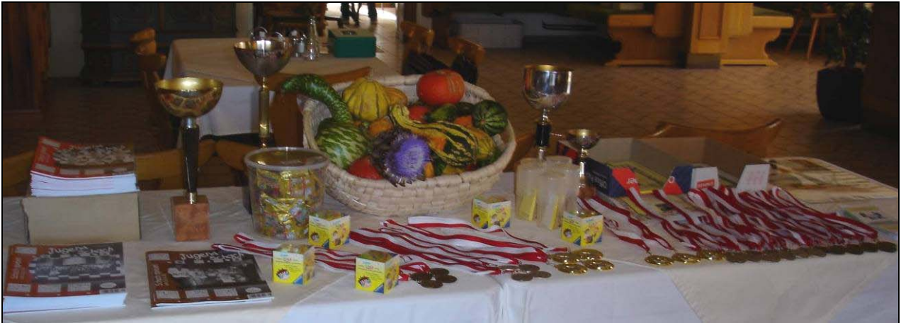
Jede Menge Preise gab es beim diesjährigen Rupertiturnier der SG Süd / Inter / Royal für die Teilnehmer