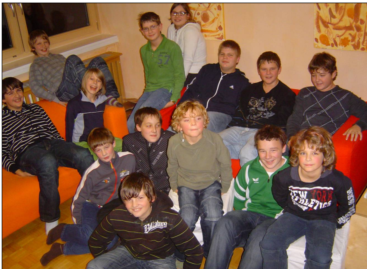
Ausgelassene Stimmung unter den 14 Teilnehmerinnen und Teilnehmern kurz vor der Siegerehrung