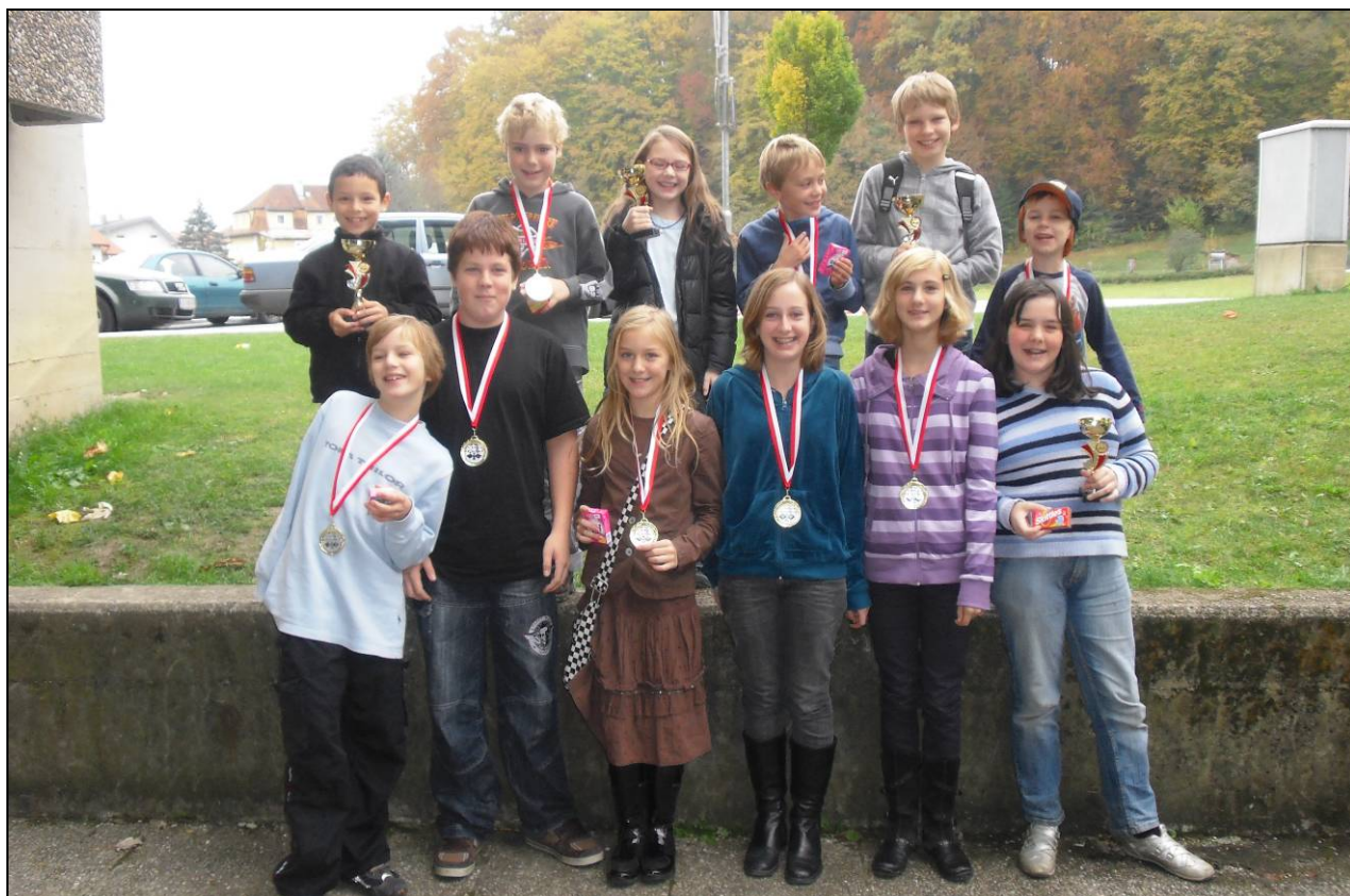
Die 12 Teilnehmer bzw. Teilnehmerinnen am 2. Entry-Bewerb in Oberndorf