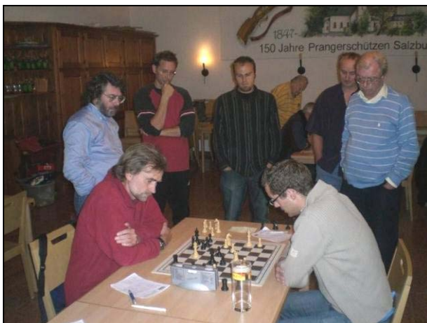
Die scharfe Partie auf Brett 2 lockte die Zuschauer