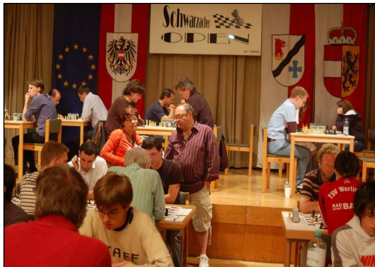
Die Spitzenbretter beim diesjährigen Schwarzacher Open

Mit 237 Spielern aus 11 Staaten kam das Schachturnier einem neuen Teilnehmerrekord nahe. Erstmals nahmen mehr Deutsche (108) als Österreicher (97) teil. Dies zeigt, dass das Turnier und die schöne Umgebung bei unserm Nachbarn sehr beliebt ist. Man kann sagen, es war ein deutsches Turnier mit österreichischer Beteiligung. Mit mehr als 2000 Übernachtungen brachte das Schachturnier auch eine große touristische Belebung der Fremdenverkehrsregion Sonnenterrasse. Der älteste Teilnehmer war 84 Jahre alt, der jüngste 9 Jahre. Daran ist zu sehen, dass Schach in allen Altersgruppen gespielt werden kann.